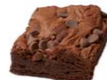
Brownie aux noix de pécan 2,00 €