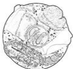
Planche de charcuterie 9,50 €

Pâté de campagne, olives à la provençale, Serrano, dés d'Emmental et sa confiture de figues, cacahuètes, patatas bravas et sa sauce, cornichons, tranches de pain et beurre salé.