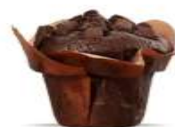
Muffin cacao crème chocolat 2,00 €