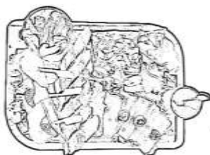
Planche de tapas 13,50 €

Pâté de campagne, olives à la provençale, Serrano, dés d'Emmental et sa confiture de figues, cacahuètes, patatas bravas et sa sauce, cornichons, tranches de pain et beurre salé.