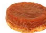
Tarte tatin 4,50 €