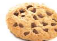
Cookie vanille aux pépites de chocolat 1,50 €