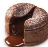
Fondant au chocolat 4,50 €